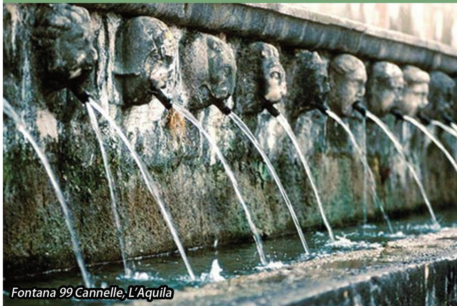
Fontana 99 Cannelle, L'Aquila

LO SCREENING IN TEMPO DI CRISI strumenti per razionalizzare l'uso delle risorse